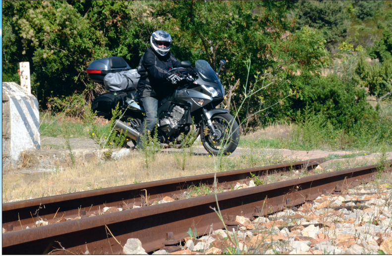
Im nordöstlichen Landesinneren treffen wir immer wieder auf die Gleise der Lokalbahn. Zug haben wir aber keinen gesehen.

Schluchten und herrliche Serpentinstraßen hinauf zu den Bergdörfern haben uns praktisch alleine gehört. Nur hin und wieder kamen uns Wohnmobile mit Schweizer Nummerntafeln und deutsche Motorradfahrer unter, die die breiten Straßen mit dem griffigen Asphalt vor allem dazu nutzten, um kräftig Gas zu geben. Zwar herrscht auf der ganzen Insel eine 90-Stundenkilometer-Geschwindigkeitsbeschränkung. Aber daran halten sich nicht einmal die Carabinieri.