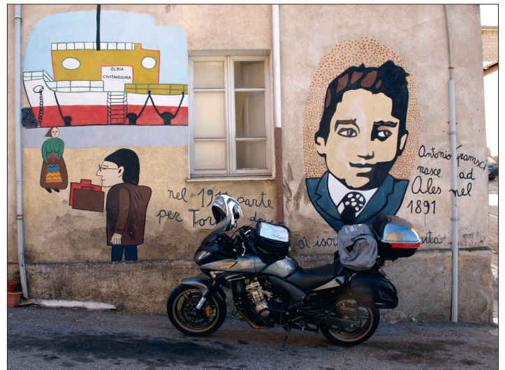
Die auf Hausmauern gemalten Geschichten haben Orgosolo zum bekanntesten Gebirgsdorf Sardinien gemacht.