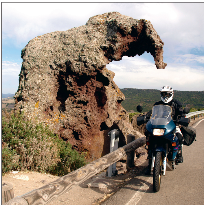
Noch ein Wahrzeichen: Der „Roccia dell'Elefante“ bei Sedini.

ner Hausmauer vor Orgosolo zu lesen ist, können wir jetzt nicht sagen. Das Schicksal der Hirten selbst, die stets mit ihrer schlechten sozialen Stellung und mit der Gefahr drohender Arbeitslosigkeit leben mussten, ist aber mehrfach auf großflächigen Gemälden dargestellt.