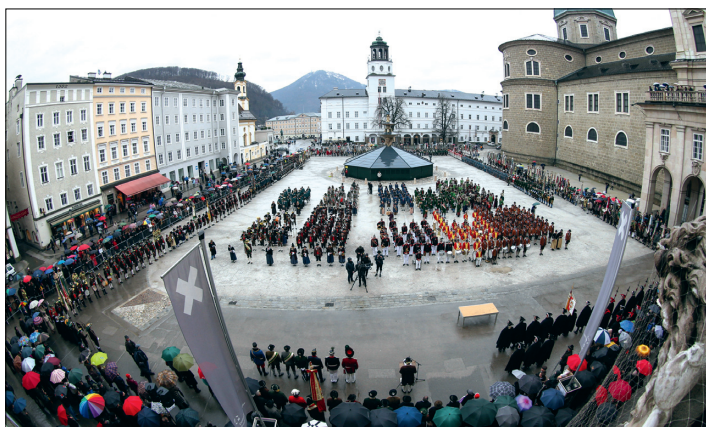
Ein imposantes Bild: 1.500 Männer von 109 Schützenkompanien aus Salzburg, Bayern und Südtirol nehmen auf dem Residenzplatz Aufstellung für den Festakt.