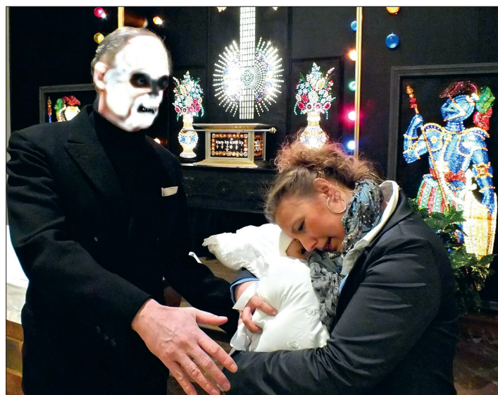
Der Tod macht vor niemandem halt.

12 Euro oder unter den Telefonnummern 06232/416627 und 0664/3241961. An der Abendkasse kostet die Karte 14 Euro.