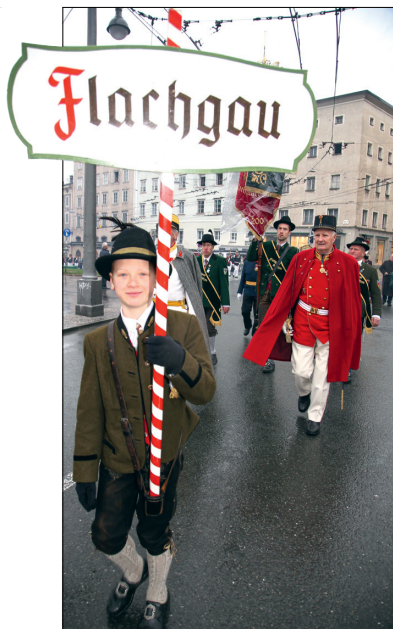
Der Flachgau war mit der größten Abordnung bei der Feier vertreten.