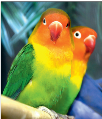
Großer Auftritt für kleine Tiere. Berndorfs Kleintierzüchter laden am 13. März zu ihrem traditionellen Kleintiermarkt.