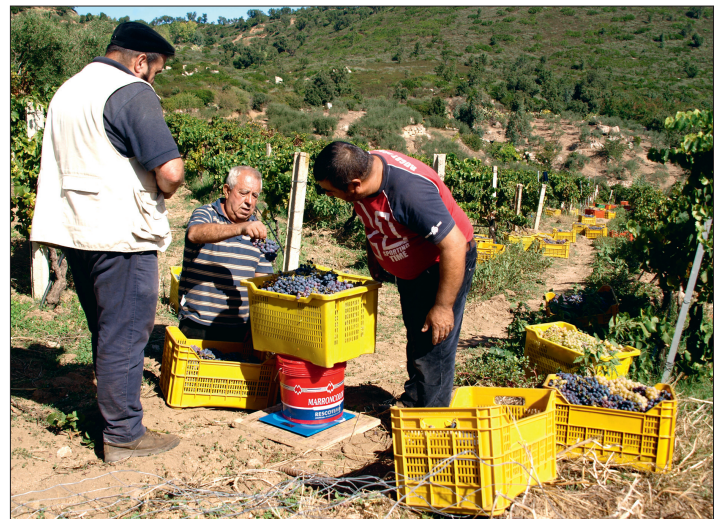
So werden Geschäfte gemacht. Die Bauern verkaufen die Weintrauben steigerweise direkt am Fusse des Weinberges an die Händler.

rädern langsam aber doch recht willig Platz machten, hatte der Hund gar kein Verständnis für die Störung. Fauchend und kläffend betrachtete er die zwei Motorräder und uns drauf einfach nur als völlig unwillkommene Eindringlinge in seine Welt.