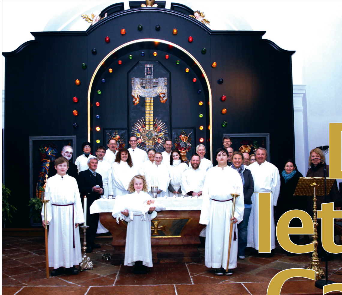
Alle Mitwirkenden des Mysterienspiels „Der letzte Gang“, das am 10. und 17. März in der Basilika Mondsee aufgeführt wird.