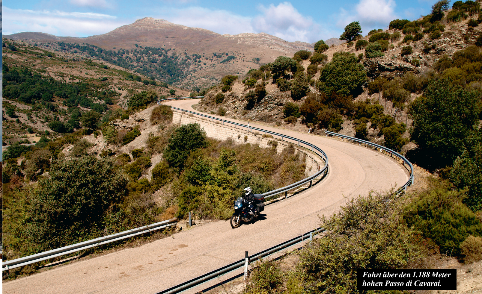
Fahrt über den 1.188 Meter hohen Passo di Cavarai.

◀ Diese Bilder haben Orgosolo zum bekanntesten Bergdorf Sardinien gemacht und sind in Zusammenarbeit der Bevölkerung mit renommierten Künstlern entstanden. Sogar ganze Schulklassen haben mitgemacht, um die Geschichte und Geschichten aus Sardinien in bunten Graffiti auf den Hausmauern sichtbar zu machen.