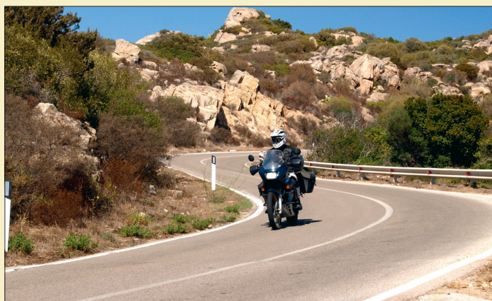
Bei diesen Straßen lacht das Herz eines jeden Motorradfahrers.

Sardiniens Straßennetz ist hervorragend ausgebaut. Auch die Nebenstraßen tragen griffigen Asphalt und sind wie für Motorräder gemacht. Generell gilt Tempo 90. Viele Autofahrer halten sich daran, aber nicht alle. Wir haben sogar Carabinieri erlebt, die wesentlich schneller unterwegs waren. Kopfzerbrechen