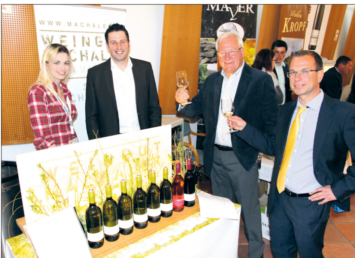
Verkosten, genießen, vergleichen und Wein einkaufen - unter diesem Motto steht die Weinmesse am 2. und 3. April im Schloss Mondsee.