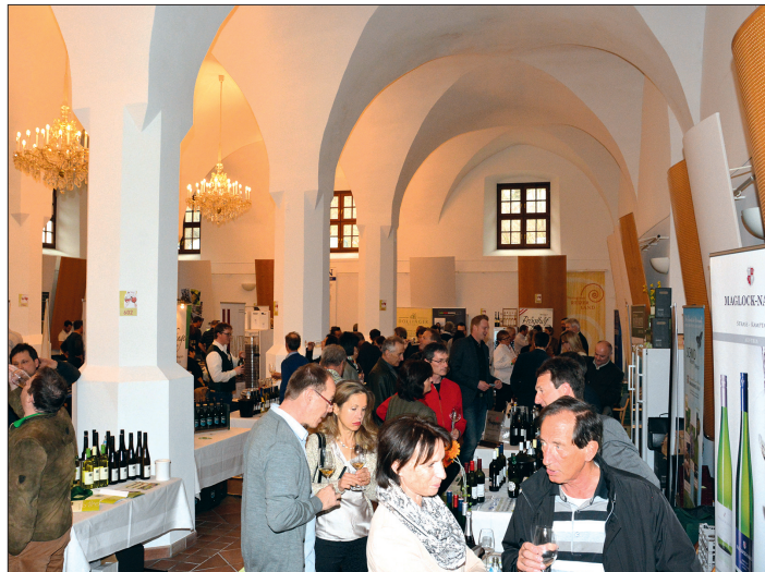
Im herrlichen Ambiente des Schlosses Mondsee präsentieren 75 Topwinzer, Weinhändler und Gourmetaussteller zwei Tage lang ihre Spezialitäten.

Verkosten, Genießen, Vergleichen und Weinkaufen. Viele sind sicherlich schon gespannt, wie die frisch abgefüllten Jungweine im neuen Jahr schmecken. Besonders reizvoll ist sicherlich auch für jeden Besucher die Verkostungsmöglichkeit der hochwertigen Barriqueweine, Süßweine bis hin zu den Schaumweinen. Bei der großen Auswahl von rund 700 verschiedenen Weinen wird sicher für jede(n) Genießer(in) der persönliche Weinfavorit dabei sein. Natürlich werden auch viele preisgekrönte Weine, die oft im normalen Handel nicht erhältlich sind, angeboten. Speziell kleine und unbekannte Winzer punkten mit einem guten Preis-Leistungsverhältnis, sozusagen mit Ab-Hof Preisen. Hinter jedem Wein steckt auch ein Gesicht und jede Menge Wissen und Geschick, durch das der Erfolg eines jeden Jahrgangs maßgeblich geprägt wird. Profitieren Sie davon, das Gesicht hinter dem Etikett und die Geschich-