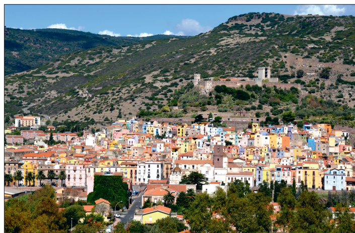
Bunt und modern präsentieren sich die größeren Städte im Landesinneren. Im Bild Nuovoro, wohin die Sarden gerne zur „Sommerfrische“ kommen.

Wesentlich lebhafter ging es da schon in Palau zu. Ein entzückender Ort, nur wenige Kilometer nordwestlich von Porto Cervo. Und Ausgangspunkt für die Fähren auf die Insel La Maddalena. Diesen Sprung über ein kleines Stückel Meer sollte jeder Sardinienreisende auf jeden Fall machen. Die Fähren verkehren im Halbstundentakt und bringen die Passagiere auf die 50 Quadratkilometer große Insel, die gemeinsam