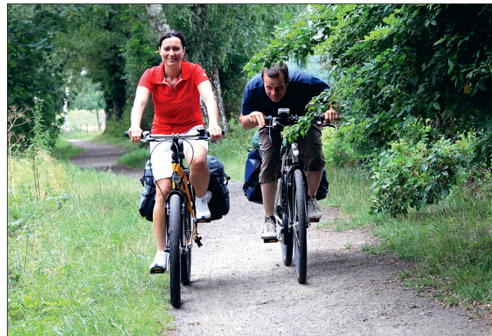
Viele Fahrradfahrer fiebern bereits der ersten Ausfahrt entgegen.

Auch in den Fahrradpneus muss der Luftdruck stimmen. Reifen, die feine Risse aufweisen oder kein Profil mehr haben, müssen gewechselt werden. Auch das Reifenalter spielt eine wichtige Rolle, da eine alte Gummierung hart wird und eine schlechtere Bodenhaftung aufweist.